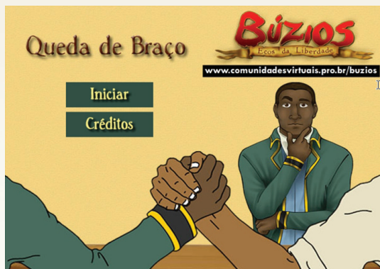
Figura 8: Tela inicial do minigame Queda de Braço