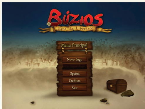
Figura 2: Menu principal do jogo