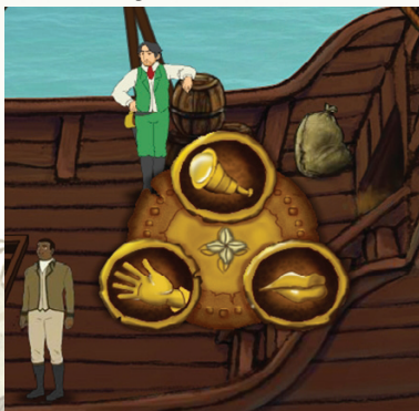
Figura 1: ícones de interação com o cenário

R. O jogador deve utilizar o cursor do mouse para apontar as ações do personagem que ele controla (Francisco Vilar). Ao clicar em um objeto ou personagem, surge um menu de possíveis ações que possibilita ao jogador interagir com o objeto ou personagem de três formas: pegar/usar/abrir (ação executada ao clicar no ícone mão); observar (ação executada ao clicar no ícone luneta); falar (ação executada ao clicar no ícone boca).