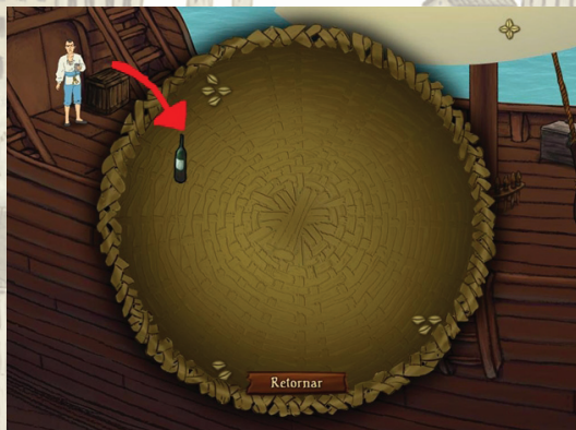
Figura 4: Inventário do jogo

R. Para combinar itens que estão armazenados no Inventário, o jogador deve arrastá-los até o objeto ou personagem que deseja combinar.