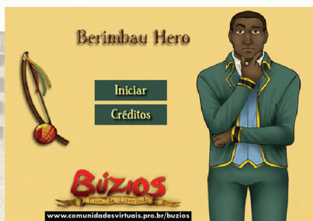
Figura 7: Tela inicial do minigame Berimbau Hero

R. Inspirado no famoso Guitar Hero, é preciso ser rápido, ágil e preciso, pressionando as setas direcionais no momento correto para tocar o instrumento com sucesso. Destacamos que o jogo é totalmente em português e você pode recomeçar cada fase ou desistir sempre que quiser sem restrições.