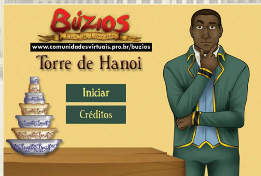
Figura 6: Tela inicial do minigame Torre de Hanói

R. O desafio desse jogo de raciocínio e lógica consiste em mover toda a pilha de pratos da haste de número 1 para a haste de 3 sem mudar a ordem em que eles estão colocados. Lembrando que você só pode remover um disco por vez e o disco maior nunca pode ficar sobre o menor, pois os discos são devem ser organizados na ordem crescente.