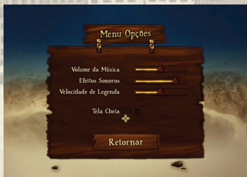
Figura 3: Tela de Opções

R. No Menu, no comando Opções, o jogador tem como alterar o volume da trilha sonora do jogo (música), arrastando com o mouse a barra apresentada ao lado do item Volume.