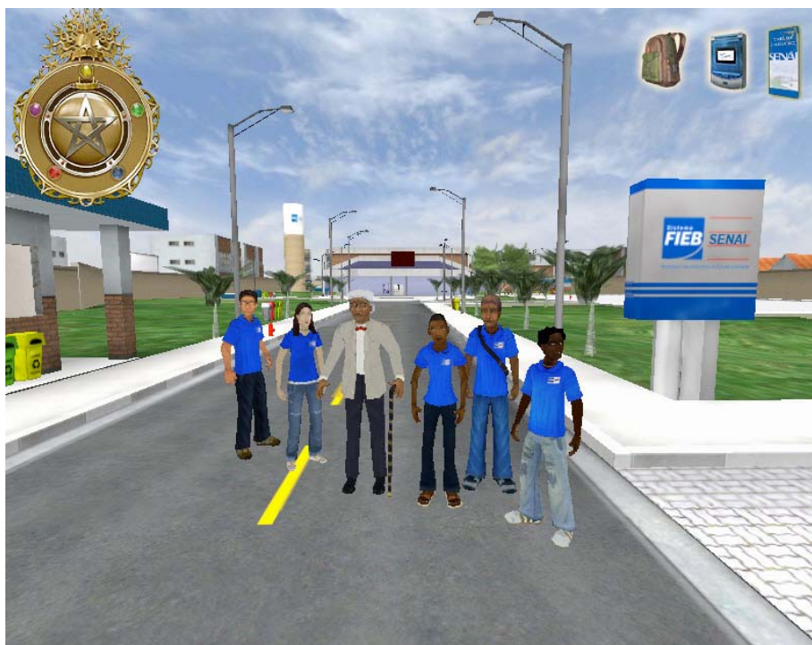
A figura 2 mostra os personagens principais em frente à escola do SENAI.