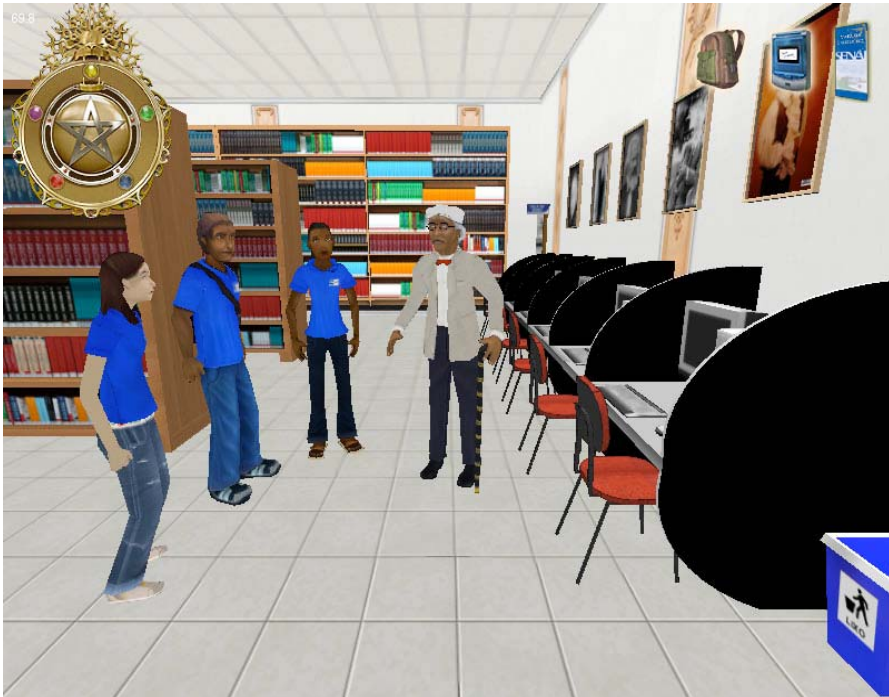
A figura 3 mostra os personagens na biblioteca da escola.