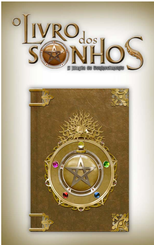
A Figura 1 mostra o Livro e a Identidade visual do Jogo: O LIVRO DOS SONHOS.